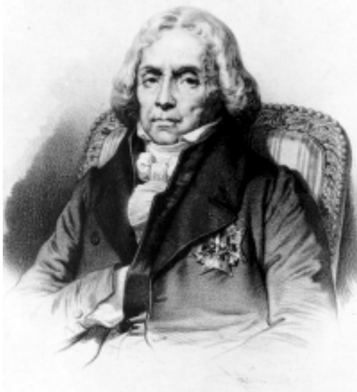
Le prince de Talleyrand, alter-ego de Fouché.

En fouillant l'impénétrable réseau de noms, d'événements et de contre-événements - nous avons affaire ici à l'une des périodes les plus tumultueuses de l'histoire - une chose est très claire ; contrairement à l'historiographie officielle, la Terreur n'était en aucune façon une flamme sacrificatrice, purgeant tout ce qu'elle touchait, et où l'on ne déplora que quelques «regrettables bavures». Rien de positif ne sortit jamais de la