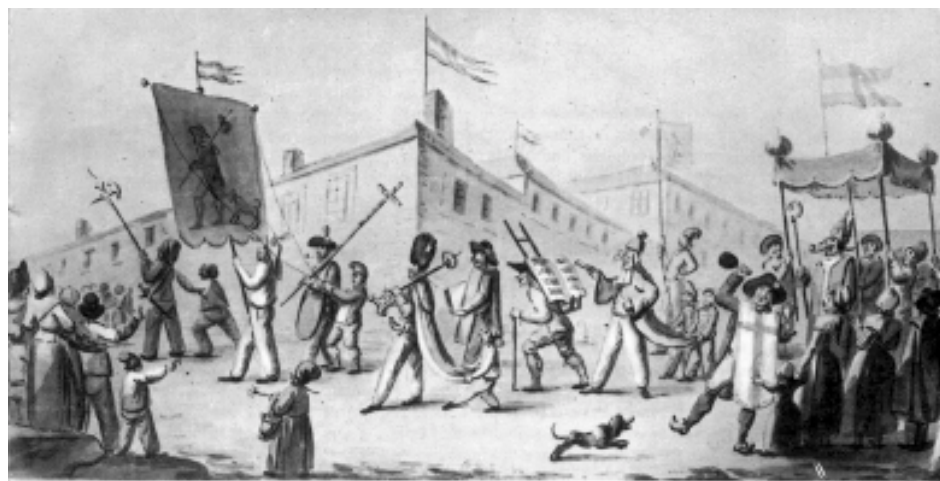
Exemple des nombreuses mascarades antireligieuses et sacrilèges : l'ancien séminariste Fouché écrit en 1793 une tirade contre le clergé et la religion qui «avilit l'homme et le dégrade».

que trop évident que ce Napoleone , ce Consul à vie qui allait bientôt devenir empereur, ne tolérerait aucune forme d'activité politique. Les ambitieux se sont alors précipités vers la fonction publique non pas pour servir l'intérêt public, mais leur propre patrimoine, afin de s'enrichir aux dépens des nations que Napoléon allait écraser. D'autres bourgeois aisés cherchent un exutoire «politiquement correct» à leurs énergies frustrées en se focalisant sur le plaisir de sens et notamment la gourmandise dévergondée (voir à cet égard La physiologie du goût de Brillat-Savarin). 9