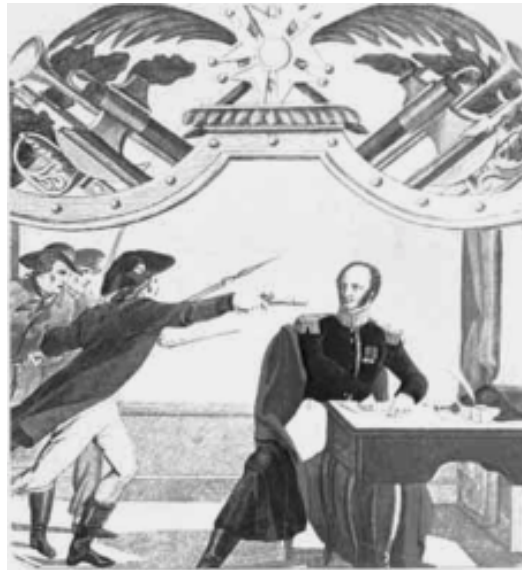
L'assassinat du maréchal Brune. Nommé au ministère de la police par Louis XVIII, Fouché lance la terreur blanche contre les bonapartistes.

C'est sous Fouché que l'on voit la naissance de ce qui deviendra l'«Administration». Pour les Français cultivés, il n'était