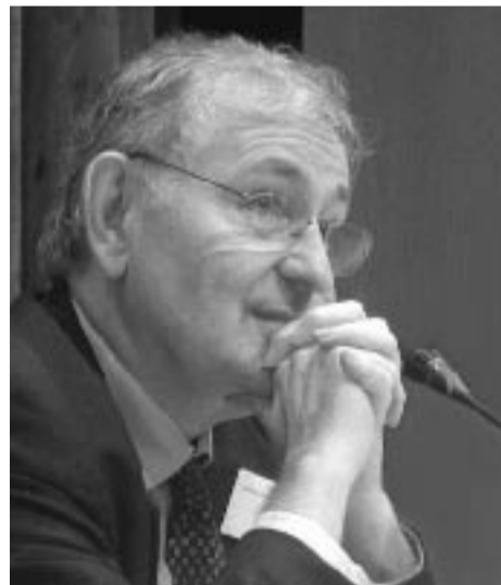
Jacques Cheminade, président de Solidarité & Progrès, candidat à la présidentielle de 1995 et à nouveau en 2007.

de défendre une perspective rooseveltienne. Chose que Kerry a fini par faire, mais trop peu et trop tard.