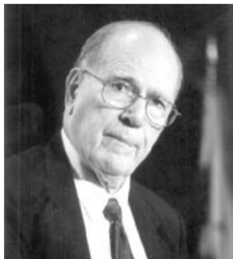
Lyndon LaRouche, économiste et polémiste américain, candidat à l'investiture démocrate pour la présidentielle 2004.

Depuis 1976, notre inspirateur, l'économiste et polémiste américain Lyndon LaRouche, a été candidat à chaque élection présidentielle américaine. Calomnié et injustement condamné à quinze ans de prison (dont cinq effectives), certains le surnomment le "Mandela américain". Lors de la dernière élection, LaRouche a appelé à voter contre Bush et pour Kerry, qu'il a convaincu